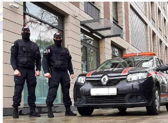
Группа быстрого реагирования